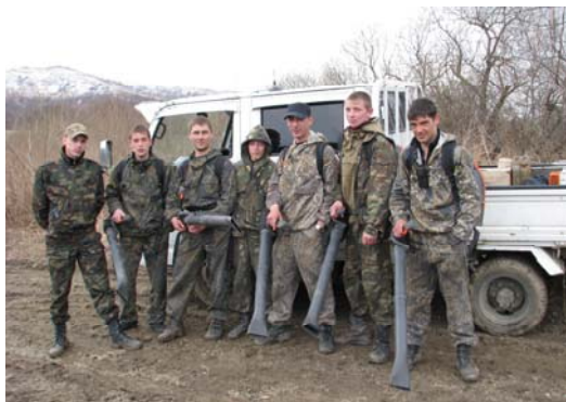
Противопожарная команда «Северная» (Славянка)