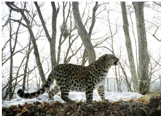
Дальневосточный леопард (фото с фотоловушки)

За дополнительной информацией обращаться: Дэйл Микелл, Общество сохранения диких животных (WCS), Россия – dmiquelle@wcs.org www.wcsrussia.org